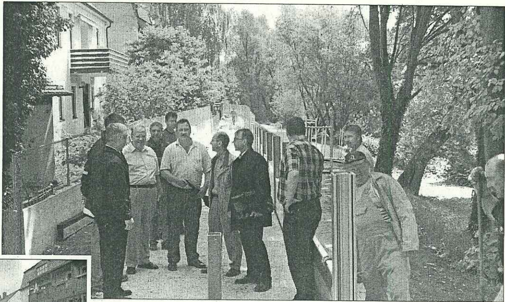
Diskussion bei der Übergabe an die Stadt

Den Grundschatz lässt sich die Stadt Regensburg insgesamt 850 000 Euro kosten. Sie tritt damit in Vorkasse, bis der Freistaat Bayern den 100-jährlichen Vollschutz realisiert. 60 Prozent der Summe betreffen den Bereich Franziskanerplatz und 40 Prozent den zweiten Lückenschluss Wassergasse. Die Summe beinhaltet