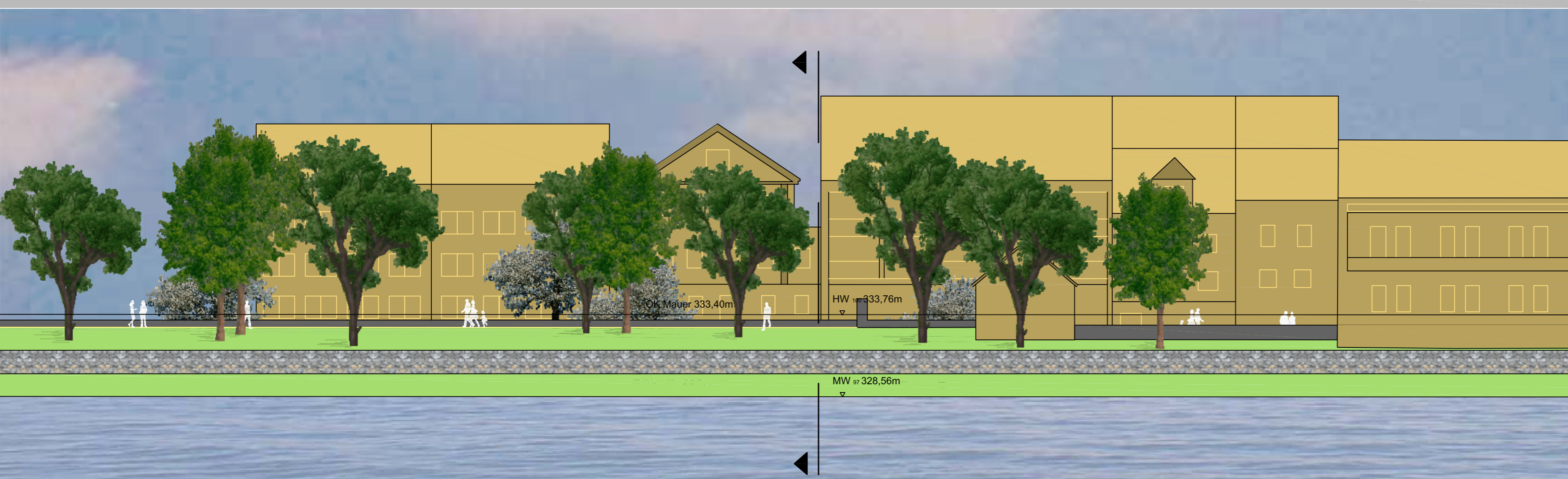
ANSICHT M 1:200