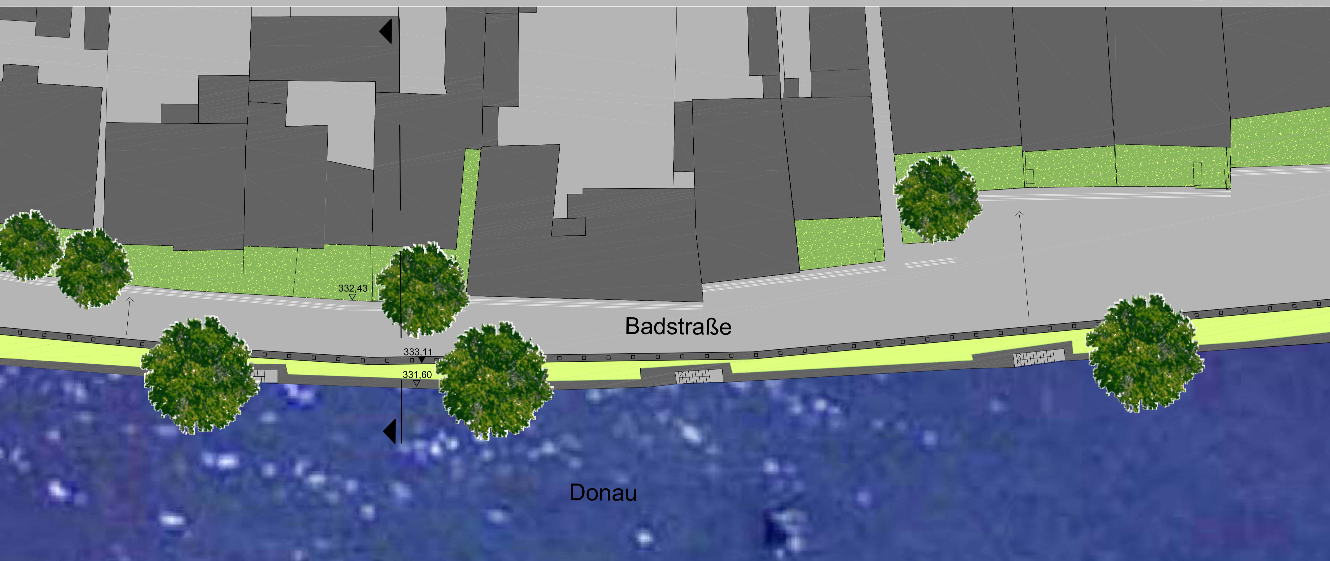
LAGEPLAN M 1:200