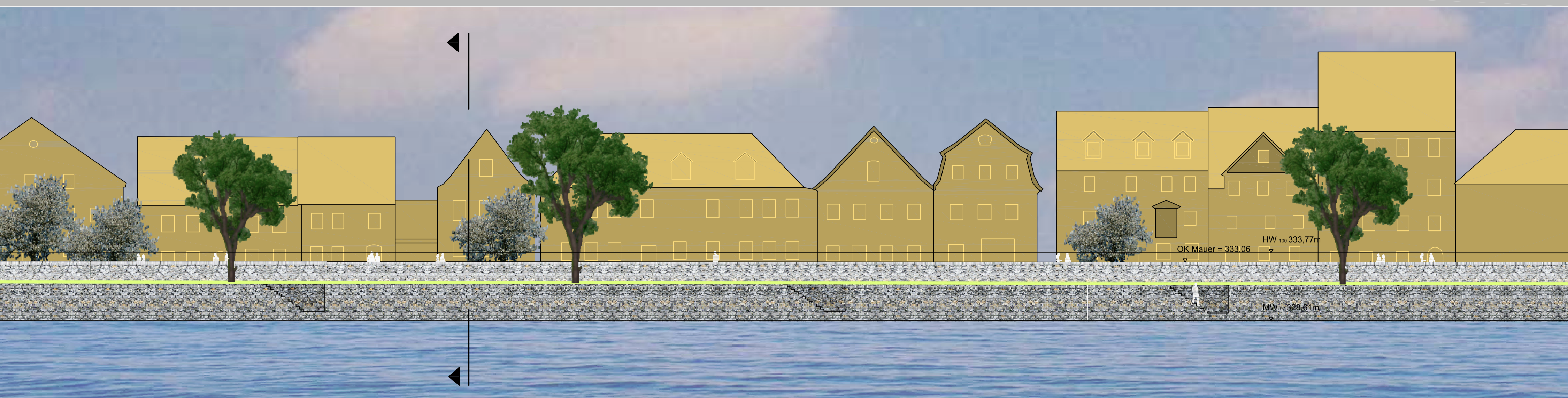
ANSICHT M 1:200